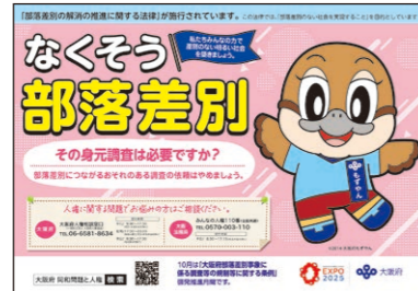
(令和5年度啓発ポスター)